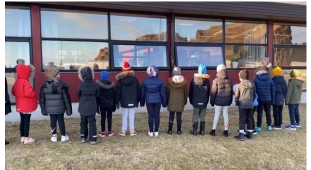
À Vestmannaeyjar, des écoliers chantent pour des personnes confinées en maison de retraite

Comme partout en Europe, les établissements recevant des personnes âgées dépendantes sont fermés aux visiteurs, d'où un grand nombre d'actions pour rompre leur isolement, notamment des concerts sous leurs fenêtres, y compris par des chanteurs célèbres.