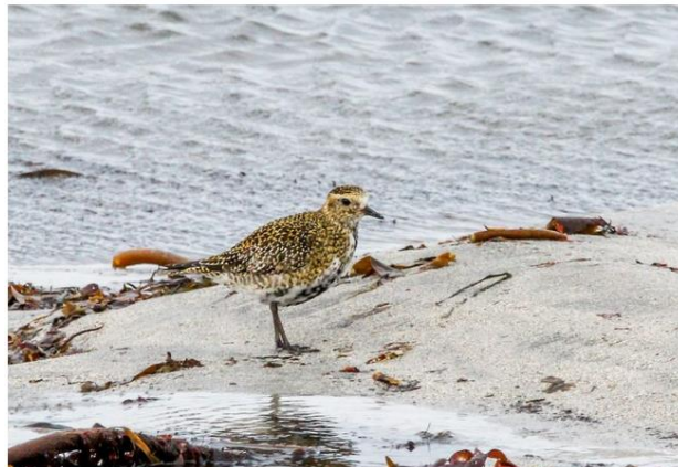
le pluvier doré est arrivé