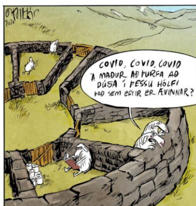
Covid (x3), devons-nous rester confinés en ce lieu pour ce qui nous reste de vie ?

Ces lignes sont le résultat de lectures, de suggestions et d'informations que je peux obtenir autour de moi, mais elles n'engagent que ma seule responsabilité. Vous pouvez aussi consulter mon blog sur https://www.sg-ms.net .