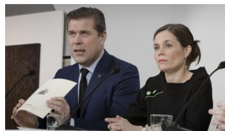
alliés jusqu'où, et quand ?