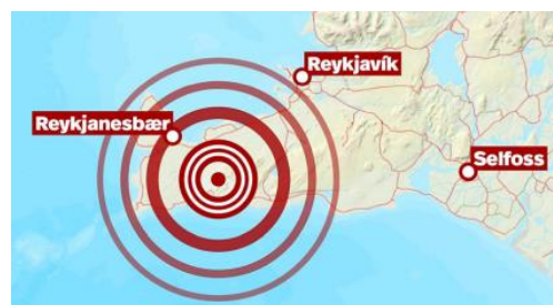
très proches de l'épicentre : Grindavík et Lagon Bleu