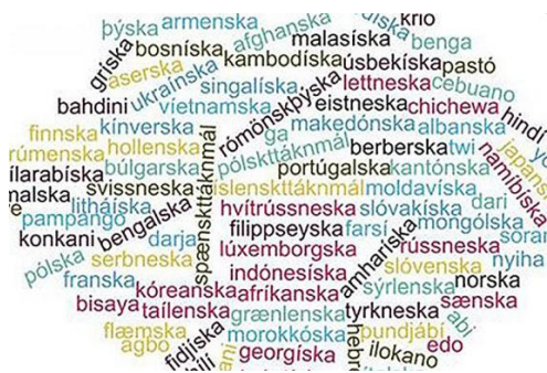
composition parue sur le site web de Reykjavík