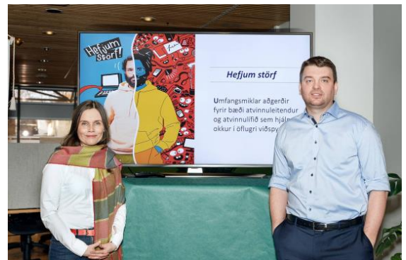
Katrín et Ásmundur Einar

Le 15 mars Katrín Jakobsdóttir et Ásmundur Einar Daðason, ministre des Affaires Sociales (parti du Progrès), avaient présenté le dispositif Hefjum störf (mettons nous au travail). Il s'agissait de financer la création de 7000 emplois dans les services publics nationaux et locaux, les associations, et les entreprises de moins de 70 salariés 6 . Pour chaque personne recrutée alors qu'elle est sans emploi depuis au moins 12 mois, l'employeur recevrait pendant 6 mois une aide mensuelle de 472 000 Ikr (3120€) plus une contribution de 11.5% de la part de la caisse de retraite. Les autres entreprises pourraient aussi recevoir une allocation pour le recrutement d'une personne sans emploi depuis au moins 30 jours. L'allocation serait alors de 307430 Ikr (2033 €) pour 6 mois, plus la contribution de 11.5%. En outre les associations bénéficiaires du dispositif pourraient bénéficier d'une aide complémentaire de 25% de l'allocation pour lancer de nouveaux projets générateurs d'emplois. Budget total estimé : 4.5 à 5 milliards d'Ikr (33 millions d'€).