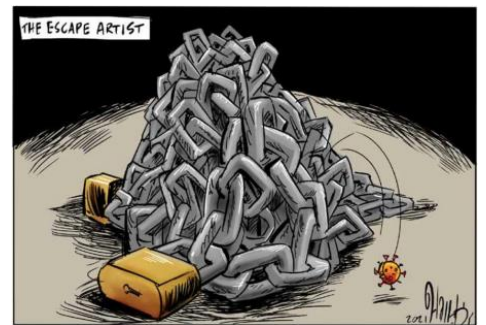
le champion de l'évasion