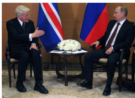
Ólafur Ragnar et Vladimir

Il ne surprendra personne que l'invasion de l'Ukraine ne laisse aucun Islandais indifférent. Leur pays est cofondateur en 1952 du Conseil Nordique et la participation à ses travaux est perçue comme une évidence, même par les plus nationalistes. À ce titre ils savent combien les autres membres du Conseil, ainsi que les pays Baltes, sont depuis plusieurs années très préoccupés par les mouvements militaires russes à leurs