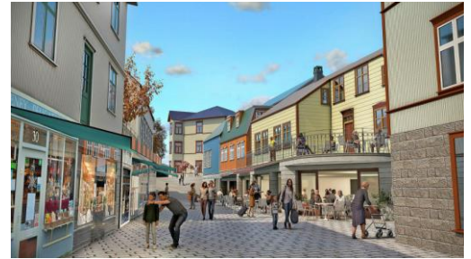
Selfoss à venir « ef veðrið leyfir » (si le temps le permet) !