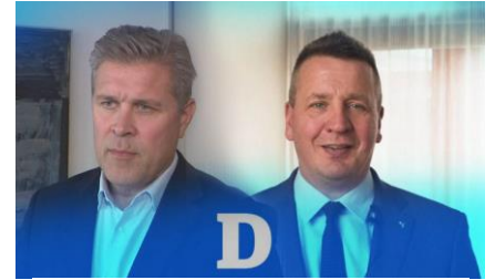
« D » = parti de l'Indépendance

deçà de son résultat électoral, et très en deçà de ses niveaux anciens. Ce glissement est l'un des arguments avancés par Guðlaugur Þór Þórðarson, ancien ministre des Affaires Étrangères « rétrogradé » à l'Environnement, pour poser sa candidature à la présidence du parti lors du congrès de novembre. Bjarni Benediktsson, président depuis 2009 et candidat à sa propre succession, en prend acte avec une remarque perfide : « comment vouloir présider le parti quand on n'a pas obtenu un bon résultat dans une circonscription importante ! ». Bruits de bottes encore ?