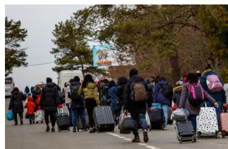
malheureusement ce ne sont pas des touristes !

Fin septembre 385230 personnes vivaient en Islande, 186840 femmes, 198280 hommes et 120 transgenres, soit 3860 de plus qu'à la fin du deuxième trimestre. Et 10400 de plus que fin septembre 2021, donc une progression de 2.4%. Islandais ? 322250 à comparer à 320690 voici un an (+0.5%) ; autres ? 62990, mais seulement 54140 en 2021 soit + 16.3%. Les mouvements migratoires de ce dernier trimestre sont significatifs : 950 citoyens islandais ont quitté l'île, dont la moitié vers le Danemark, alors que seulement 800 y sont revenus. A l'inverse, 4680 étrangers sont arrivés, dont 1150 venus de Pologne et 480 d'Ukraine, et 1270 sont partis, soit un solde de 3410.