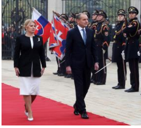
Avec Zuzana Čaputová présidente de Croatie

A ces rencontres il convient d'ajouter des échanges plus symboliques mais qui témoignent de la volonté islandaise d'être aussi présente au monde que possible :