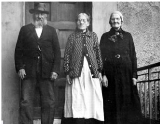
heureux retraités !

- 15/11 : pourtant ils n'ont jamais été aussi nombreux en vacances à l'étranger : 72000 en octobre,