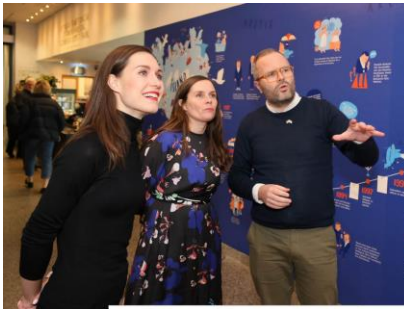
Sanna et Katrín admirent des fresques célébrant l'amitié finno-islandaise

Mais il n'y a pas que l'Ukraine. Le 24 novembre la ministre et Annalena Baerbock, sa collègue allemande, font voter par la Commission des Droits de l'Homme de l'ONU une motion (voir communiqué ) demandant la création d'une commission d'enquête sur les violations des droits des femmes et hommes en Iran.