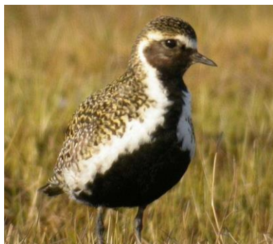
le pluvier est arrivé