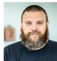
nouveau héros national?