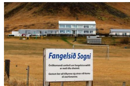
ceci est une prison...

Mais tant que Jón Gunnarsson reste ministre la fermeté est de rigueur, et de nouveaux moyens doivent accompagner l'accroissement et les besoins de la population. C'est pourquoi il vient d'annoncer un plan d'action visant à renforcer les ressources de la police (actuellement 700 personnes) : augmentation des effectifs (+80 personnes réparties en 30 policiers de terrain supplémentaires, 10 policiers à la frontière, et des spécialistes sur divers domaines telles les enquêtes), amélioration et allongement de la formation. Autre décision : le nombre de places de prisons va passer de 40 à 70.