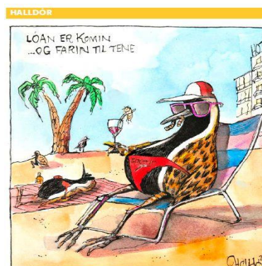
... et reparti à Ténérife