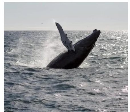
bravo Svandís !!!

Le motif officiel est un rapport commandé par la ministre sur les conditions de cette pêche, notamment son respect (?) des animaux concernés. Le rapport est accablant : alors que les règles internationales imposent que les baleines soient tuées d'un seul coup de harpon pour limiter leur souffrance, l'agonie des 148 baleines tuées en 2022 a duré en moyenne 11.5 minutes, et pour 36 d'entre elles il a fallu plus d'un tir (jusqu'à 5). De ces 148 baleines 108 étaient des femelles, 11 étaient gestantes et 1 allaitait. En deuxième partie de cet article , on peut voir à partir de 3 minutes une vidéo présentée par la ministre pour