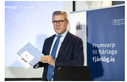
un ministre heureux...

Bjarni Benediktsson, ministre des Finances et président du parti de l'Indépendance, se félicite d'abord de l'état des finances publiques dont la balance sera supérieure de 100 milliards d'Ikr à ce qui était prévu et devrait être meilleure encore en 2024. Cette situation permet de mettre dans le budget l'accent sur le maintien des revenus nets en réduisant le poids de l'impôt sur le revenu. De plus l'État va diminuer ses dépenses tout en préservant la santé, l'éducation et la justice. Parmi les gains ou économies prévues le ministre cite une réduction des aides à l'achat de voitures électriques puisque le mouvement est déjà bien engagé, la taxation des nuits d'hôtel et des escales de bateaux de croisière. Le plus gros investissement sera comme l'an passé la construction de l'Hôpital Central, mais le gouvernement veut aussi favoriser les investissements en R&D. De plus un certain nombre d'aides sont prévues, notamment pour les familles.