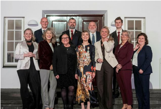
déjà au vent !

Ils seront onze dont quatre hommes, quatre ministres venus de l'ASP, quatre de Redressement, trois du parti du Peuple. Ils sont présentés ici en anglais. On remarquera que de ces onze deux seulement ont déjà exercé des fonctions ministérielles : Þorgerður Katrín Gunnarsdóttir (Redressement), ministre des Affaires Étrangères et Logi Einarsson (ancien président de l'ASP) ministre de la Culture et des Universités. Neuf nouveaux ministres, vingt nouveau députés... Ce renouvellement tiendra-t-il ses promesses ?