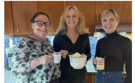
kaffi og kökur ?

Comme toujours en Islande les différences dans les programmes des divers partis ne sont pas telles qu'une véritable culture du compromis et l'envie de gouverner ne puissent aplanir – ou pousser sous le tapis... – ainsi de la fiscalité ou l'immigration, voire l'adhésion à l'Union Européenne. Mais on a affaire à trois femmes totalement différentes tant par leur âge, leurs origines sociales et géographiques, que par leur parcours. Je les présente dans cet article de blog , allant de la jeune technocrate à la fille de pêcheur, chanteuse et championne de karaoké, en passant par la grande bourgeoise de la capitale, déjà plusieurs fois ministre. Réalité ou mise en scène ? Tout au long de leur négociation les trois Valkyries semblent avoir plaisir à se rencontrer chez l'une ou l'autre et être heureuses de travailler ensemble.