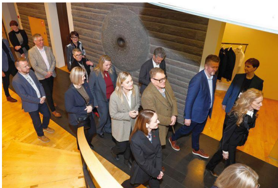
pré-entrée : les « nouveaux » viennent visiter leur futur lieu de travail

Comme prévu le scrutin du 3 novembre a produit un bouleversement de la vie politique islandaise (voir ma dernière chronique ). Mais pas la révolution annoncée par les sondages : comme à chaque élection législative où il était annoncé grand perdant, le parti de l'Indépendance a réussi à réduire ses pertes (de 16 à 14 députés). A l'inverse, ses deux alliés ont été laminés : disparition de la Gauche Verte, réduction de 13 à 5 députés pour le parti du Progrès. Dans l'ancienne opposition la surprise vient du parti du Peuple