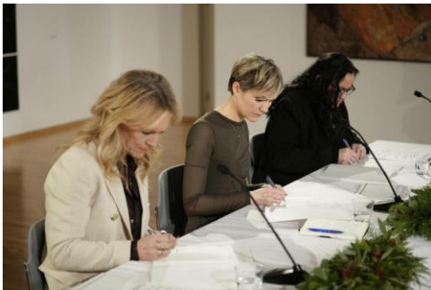
signature de l'accord de législature

Le 21 décembre sont connus l'accord de législature et le gouvernement en charge de l'appliquer. Il n'y a pas vraiment de surprises dans cet accord. Comme pour le gouvernement précédent l'accent est mis sur l'accès au logement et aux soins médicaux sur l'ensemble de l'île, avec toutefois une attention particulière aux plus démunis, quelle que soit leur origine. On y insiste aussi sur la préservation de l'identité islandaise, sa langue, sa culture et sa nature, ce qui est un moyen de favoriser l'intégration des étrangers. Simultanément le gouvernement sera vigilant sur l'immigration clandestine, à l'instar de ce que font les autres Pays Nordiques. Pour ce qui concerne l'environnement l'accord maintient l'objectif de la neutralité carbone à horizon 2040. La politique étrangère de l'Islande sera dans la ligne atlantiste déjà appliquée et s'efforcera de profiter au mieux de son adhésion à l'Espace Économique Européen. En 2027 les citoyens islandais seront amenés à se prononcer sur une relance de la négociation d'adhésion à l'UE.