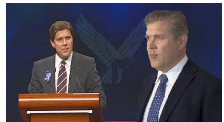
comme le temps passe...

Car voici que Bjarni, encore lui, jette un nouveau pavé dans la mare, de son parti cette fois : non seulement il démissionne de son mandat de député, mais il ne sera pas candidat à sa succession lors du prochain congrès de son parti. Élu président en mars 2009, au moment où le parti de l'Indépendance venait, première fois en 19 ans, d'être rejeté dans l'opposition pour cause de crise financière, Bjarni aura occupé cette fonction plus longtemps que Davíð Oddsson mais n'atteindra pas le record établi par Ólafur Thors (27 ans) !