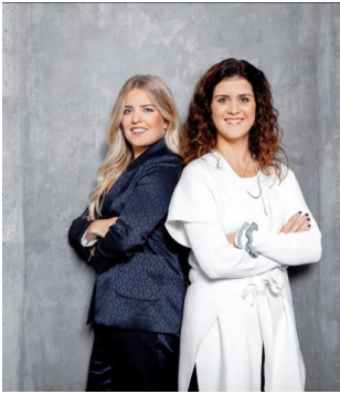
Áslaug Arna et Þórdís Kolbrún

Þórdís Kolbrún Gylfadóttir, vice-présidente du parti, surprend à son tour lorsqu'elle annonce qu'elle ne postulera pas à sa présidence, contrairement à une ambition affichée quelques mois plus tôt. Retour à sa famille (Þórdís Kolbrún a 37 ans et est mère de 2 enfants) comme Bjarni ou manque de soutien ? À ce jour, seule a candidaté Áslaug Arna Sigurbjörnsdóttir, 35 ans, plusieurs fois ministre dans les gouvernements précédents. Le parti de l'Indépendance présidé par une femme, jeune de surcroît ? D'autres candidatures sont en construction pour un congrès prévu fin février.