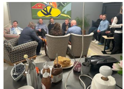
26 février chez le Médiateur on prépare les gaufres !

Résultat ? Un accord quadriennal prévoyant des augmentations de salaires de 24 % sur la période et assorti d'un certain nombre de précautions en cas de sortie de route. Sigríður