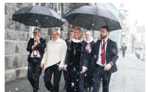
la Présidente et l'Évêque

La première session du nouvel Alþingi a lieu le 4 février. Comme le veut la tradition, cette ouverture officielle par la Présidente est précédée d'une messe à Cathédrale puis du franchissement parfois difficile des quelques mètres séparant l'une de l'autre. Même si la séparation de l'Église et de l'État est aujourd'hui réelle, les traditions ont la vie dure !